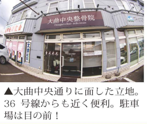
▲大曲中央通りに面した立地。36号線からも近く便利。駐車場は目の前！