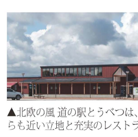
▲北風の風道の駅とうづつは、昨年9月New Open!札幌からも近い立地と充実のレストラン、野菜直売所もあり人気!

連休中に全部回るなど、自分次第で楽しめるのではないのでしょうか? 旅行会社では同企画のバスツアーも実施していますので、車のない方もぜひこの機会にチャレンジをスタートしてみませんか?