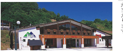
▲道の駅うたしなないチロルの湯は、宿泊施設、温泉併設!日帰り温泉OK、海外のような景色も素敵!

また、スタンプブック持参で各施設独自のサービスやソフトドリンクなどの割引もあるので、お得をゲットするにもおススメ!