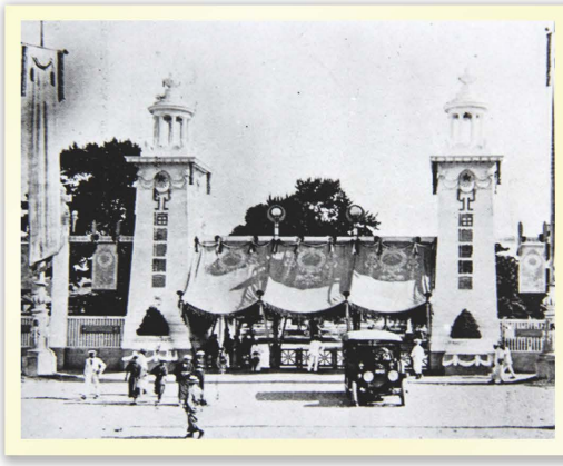
▲博覧会のメインゲート。場所は札幌駅前とのことです。博覧会のメイン会場は、中島公園内でした。当時は市政化前だったので、「札幌区」という住所名でした。